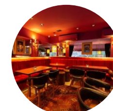
Bares e Restaurantes