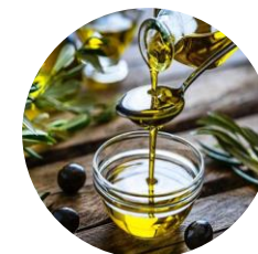
Azeite de Oliva