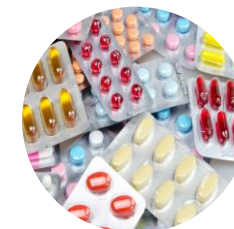
Medicamentos e material hospitalar